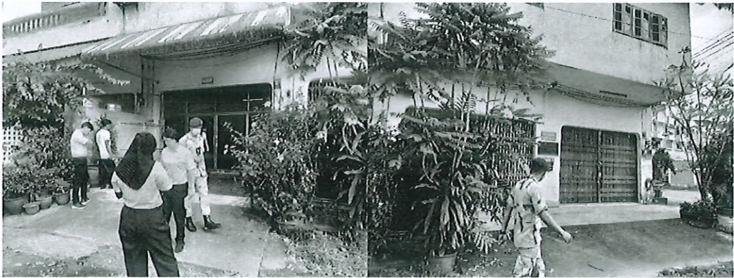
บ้านพักอาศัยผู้ร้องเรียน