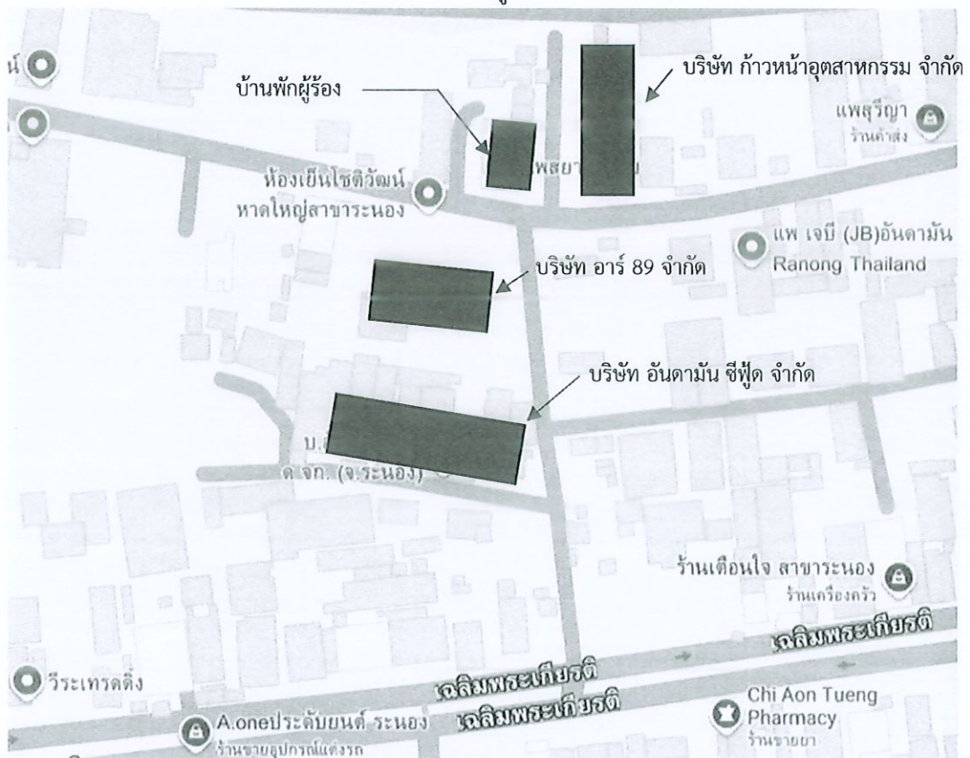
แผนผังบริเวณพื้นที่จุดร้องเรียน