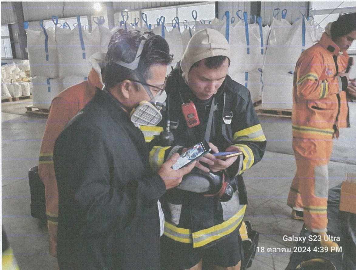
Galaxy S23 Ultra 18 ตุลาคม 2024 4:39 PM